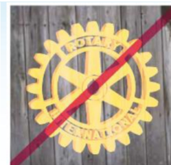
需清晰不可模糊 使用