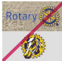
不可自行變更logo 顏色