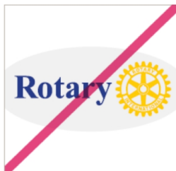
若有底框不可隨意 改變形狀