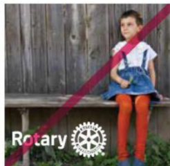
四色印刷不可用單色 logo